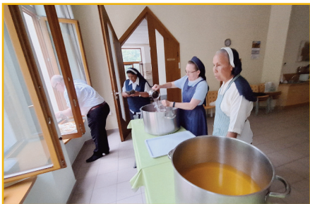
Dcéry Našej milej Matky Najsv. Srdca Ježišovho jubilujú. (30. 8.)