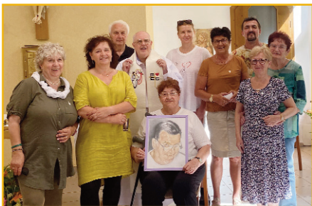
Účastníci 63. Víkendu nádeje – triezvy život www.misionari.sk/courses