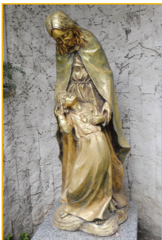
Súsošie Našej milej Matky Najsvätejšieho Srdca Ježišovho s láskavým úsmevom v areáli duchovného centra v Lukovom dvore.