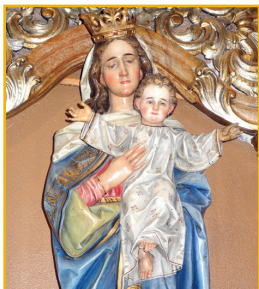
Súsošie Našej milej Matky u OFM v Trnave