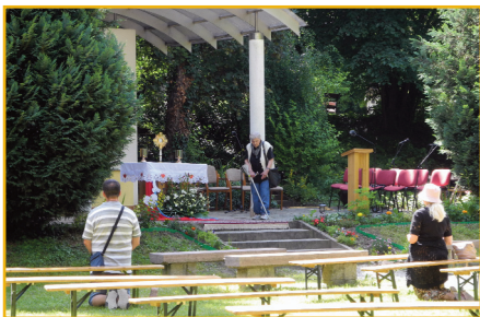
Lásku Ježišovho Srdca môžeme prijať aj cez adoráciu. (27. 6.)