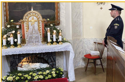
Byť v samote s Pánom smrti a života je požehnanie.