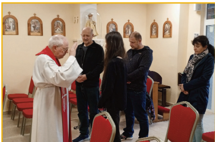
V modlitbe sa zjednotiť je dar Najsvätejšieho Srdca Ježišovho.