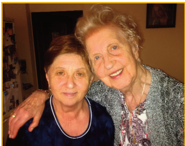
Veľa talentov spájalo Máriu s mamou+.