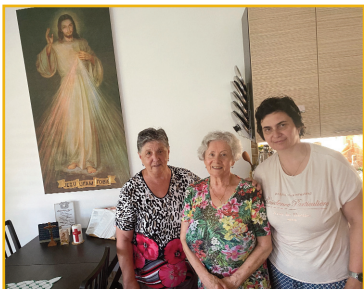
Nech Božie milosrdenstvo nás všade žehná!