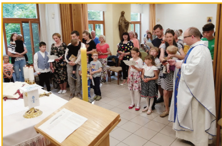
Naša milá Matka Najsv. Srdca, zasväcujeme Ti naše deti. (31. 5.)