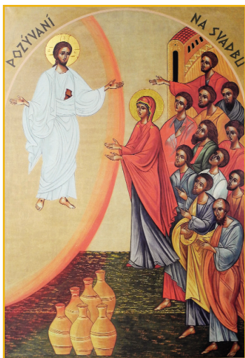
Svadba v Káne Galilejskej Obráz je v duchovnom centre Kána v Nitre-Lukov dvor.

pre teba po celý rok 2025 je jubilejný 30. kalendár Misionárov Najsvätejšieho Srdca Ježišovho. Vychádza nepretržite od roku 1995.